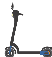
特定小型原動機付自転車のイメージ図